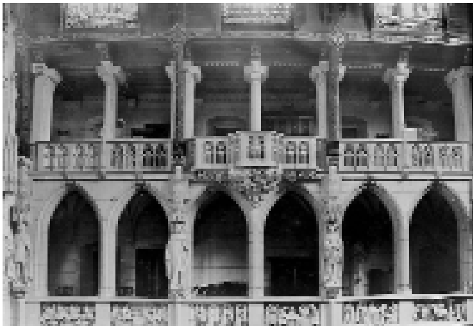
Afb. 6. Een ontwerp voor de noordoostwand van de hal, gedateerd mei 1894. Ook in deze tekening uit 1894 is nog sprake van een fries tegen de balustrade van de galerij, waarbij elke travee van één reliëf is voorzien. Tekening: NAI Haar, t 67: noordoostwand met trapbogen, mei 1894.

soortgelijke voorstelling in de middeleeuwse Codex Manesse , waarin middeleeuwse dichters naast bij de teksten van hun gedichten werden afgebeeld. 3 Onderzoek heeft uitgewezen dat Pierre Cuypers goed bekend was met middeleeuwse uitvoeringen van een motief dat hij omschrijft als “le Chateau d’amour”, “der Minne-bürch”, “Het kasteel der liefde”. Hij beschrijft het ‘zujet’ uitgebreid in een brief aan zijn zoon Joseph op 17 februari 1907, waarbij hij duidelijk aangeeft waar het reliëf met de voorstelling moet komen en hoe het precies moet worden uitgevoerd. 4 Aangezien er geen ontwerptekeningen van het reliëf bewaard zijn gebleven, is niet helemaal duidelijk op welke wijze het denkbeeld in de brief onder leiding van Jos Cuypers precies is omgewerkt tot het reliëf in de feestzaal van de Haar, dat op bepaalde punten sterk afwijkt van de beschrijving van Cuypers sr.