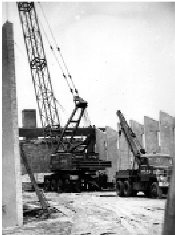
Levering van het prefab-materiaal voor de Christus Koningkerk in Hoensbroek, in 1964