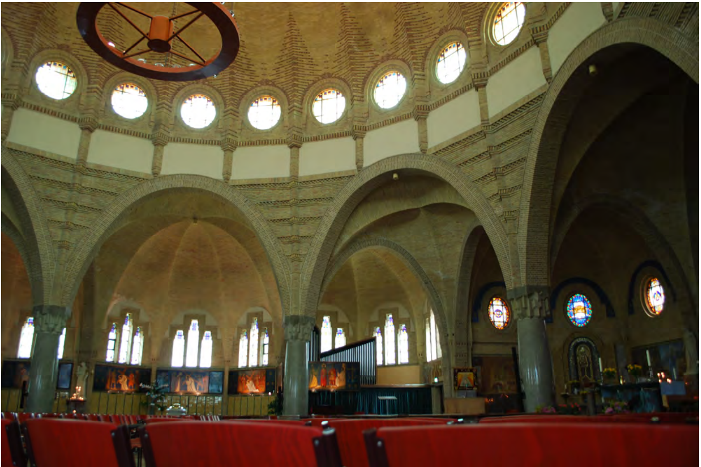
Interieur van de St. Agathakerk in Beverwijk na de restauratie.

van deze vergelijking is het feit dat het (expressieve) baksteengebruik (wat voor de totale kerk geldt, niet alleen voor de ramen) doet denken aan de Amsterdamse School, maar de geometrische vormen die zijn toegepast, meer verwant zijn aan de Art Deco. Zoals bijvoorbeeld de grillig gehouwen kapitelen van de granieten pijlers. Ook de glas-in-loodramen hebben Art Deco-motieven, in combinatie met florale Jugendstilmotieven.