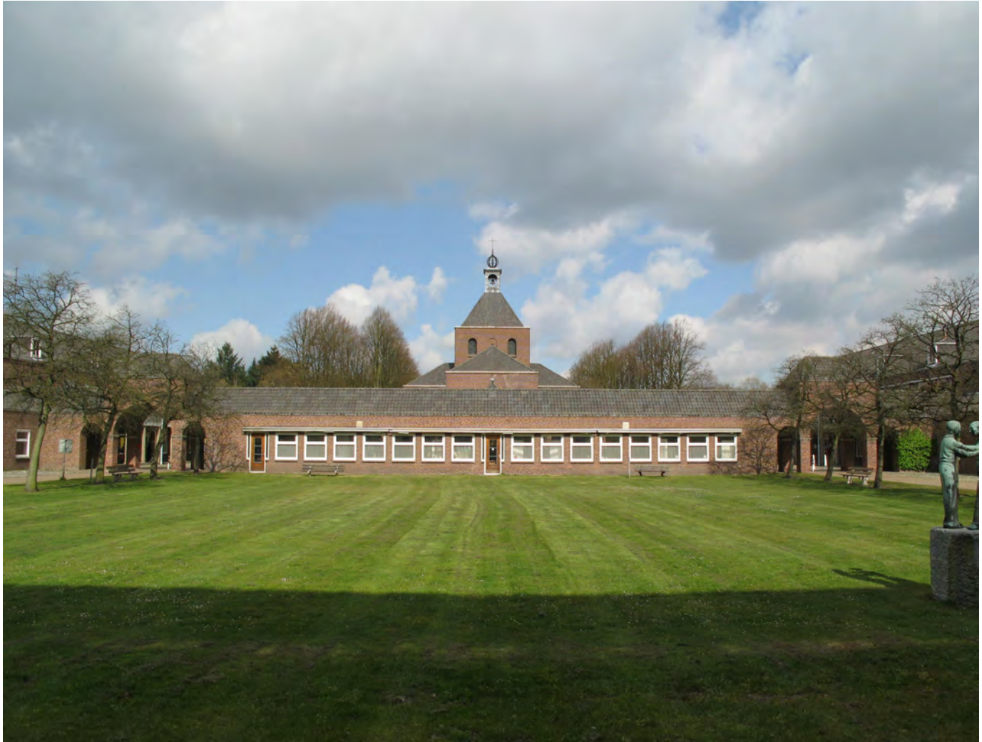
Gezicht op de kapel van De Klokkenberg.