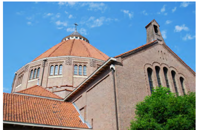
O.L. Vrouw van Altijddurende Bijstand in Bussum.

van de kerk toont ons de constructie en de verschillen tussen binnen- en buitenkoepel. Net als in Dongen, is het ritme van de bogen die de koepel dragen afwisselend groot – klein, groot – klein. Boven een grote boog bevinden zich drie ramen en boven een kleine boog twee. De ramen zijn van elkaar gescheiden door gemetselde ribben, wat zorgt voor een twintigdelig meloengewelf. De ribben komen samen in een cirkel, waarboven zich de lantaarn bevindt. Het bouw materiaal baksteen is zeer decoratief gebruikt, zowel door verschillende kleuren baksteen te gebruiken als door bijzondere metselverbanden toe te passen. Zo zijn de gewelfvelden van de nevenruimten in gele baksteen uitgevoerd. Ook fraai is de oplossing om de overgang van een ronde boogvorm naar een hoekige deur te bewerkstelligen. In de hoekige, vierkante pijlers waar de koepel op rust, zijn speciaal op maat gemetselde nissen gecreëerd voor de heiligenbeelden, afkomstig uit het atelier van Jos Cuypers.